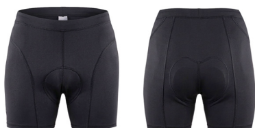
BASELAYER SHORTS 2.0

UVP 32,99 Art.Nr. 305-10024 SCHWARZ Gr.S-3XL 90% Polyester, 10% Elasthan