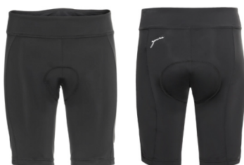
SHORTS PURA 2.0

UVP 34,99 Art.Nr. 301-30310 SCHWARZ Gr.XS-4XL 80% Nylon, 20% Elasthan