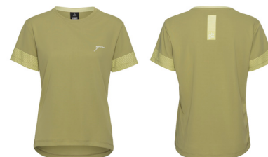
T- SHIRT VELO LOVE BASIC

UVP 24,99 Art.Nr. 300-05087 HELLGRÜN Gr.XS-4XL 100% Polyester( recycled)