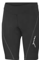
BASIC SHORTS 3.0

UVP 44,99 Art.Nr. 301-30201 SCHWARZ Gr.S-4XL 90% Polyamid, 10% Elasthan