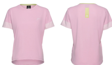
T- SHIRT VELO LOVE BASIC

UVP 24,99 Art.Nr. 300-05095 ROSÉ Gr.XS-4XL 100% Polyester( recycled)